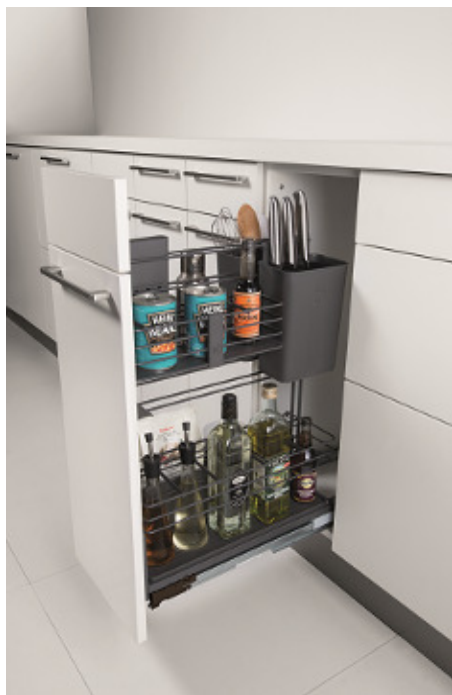
Aménagement bas pour bouteilles et aliments