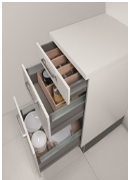
Aménagement bas Tiroir grande profondeur