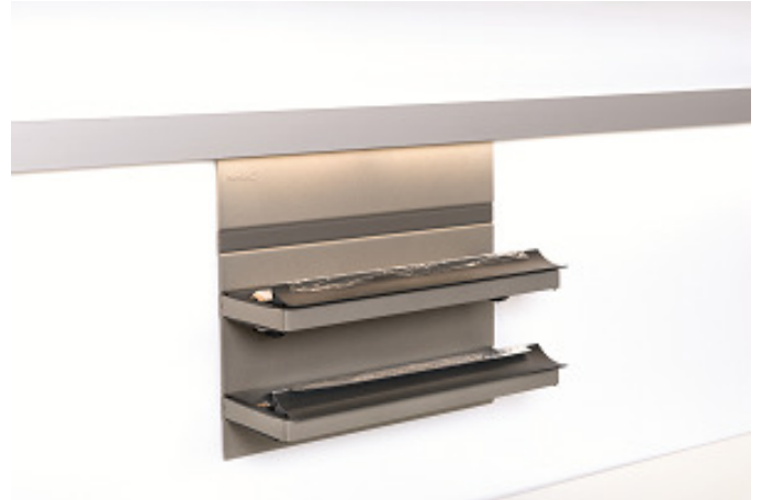
Aménagements de crédences