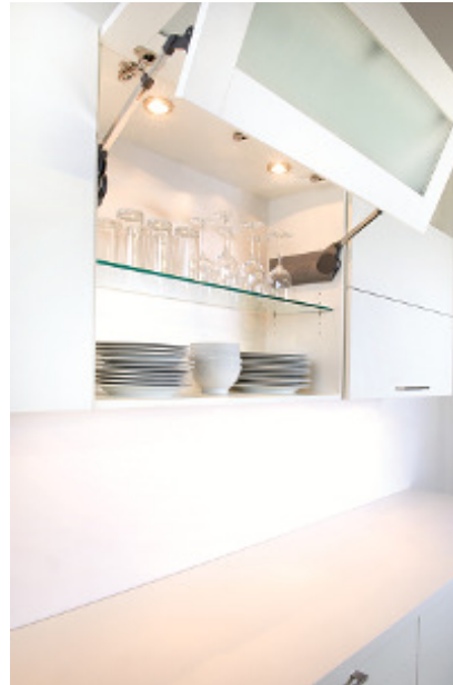
Aménagements meubles hauts