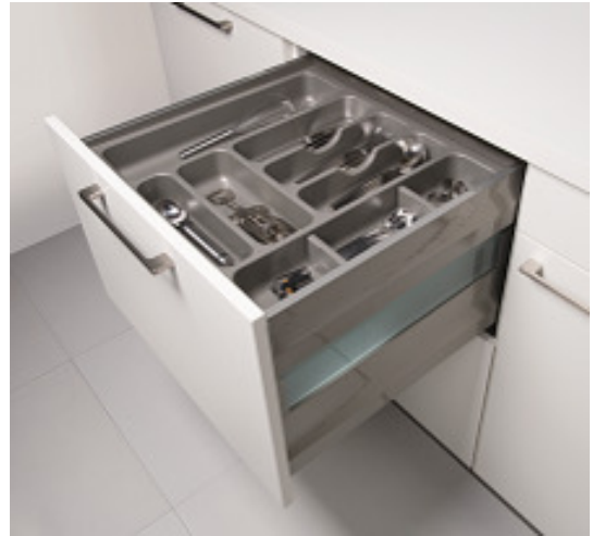
Aménagements bas coulissants