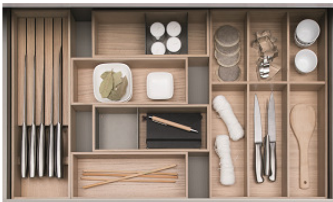
Système d'organisation intérieure pour tiroirs