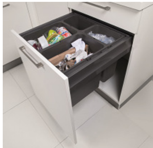
Aménagements bas coulissants pour TRI SELECTIF